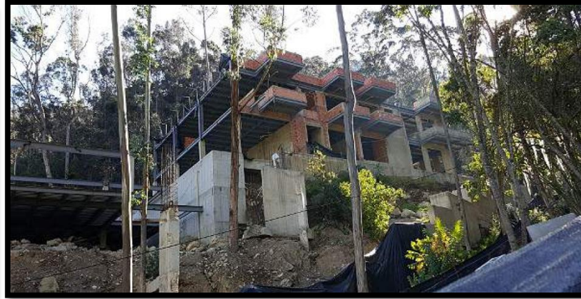
El Bambú - Chapinero