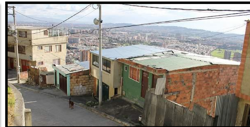
Buena Vista II Sector