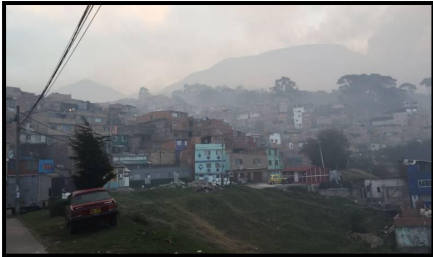
Aguas Claras - San Cristóbal