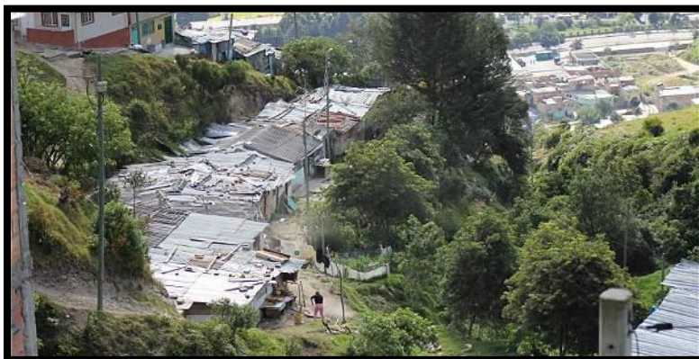
Asentamiento Arauquita - Usaquén

Orden: Proceder de forma inmediata, al trámite de normalización de las urbanizaciones que fueron excluidas del área de reserva, a fin de garantizar que su población pueda acceder a una infraestructura de servicios públicos que garantice salubridad pública