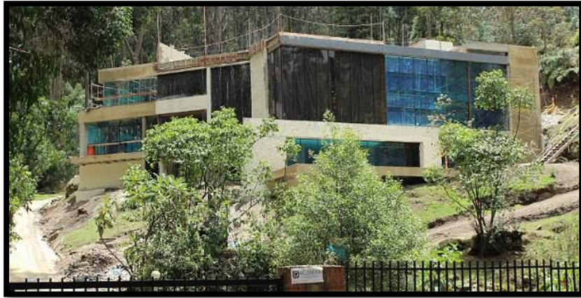
El Arrayán - Chapinero