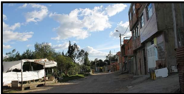
Villas de Capilla