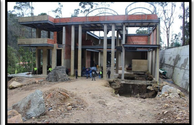
El Tuno - Chapinero