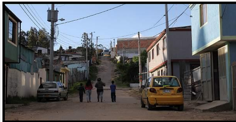
Altos de Serrezuela