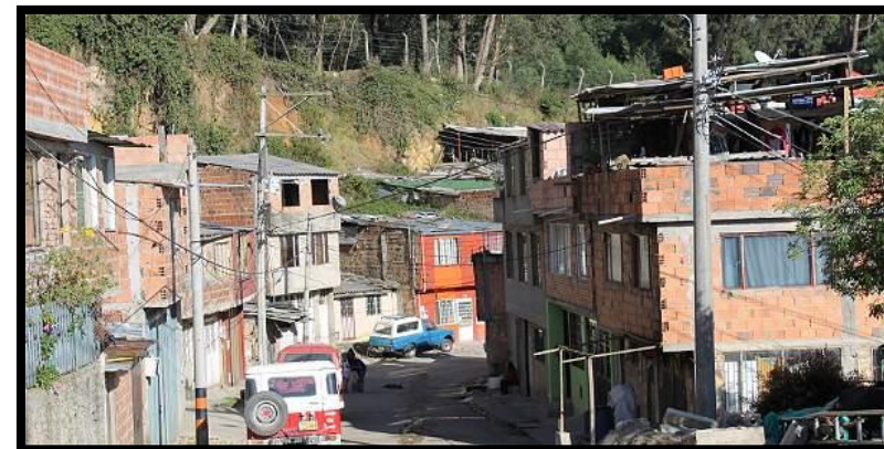
Mirador del Norte