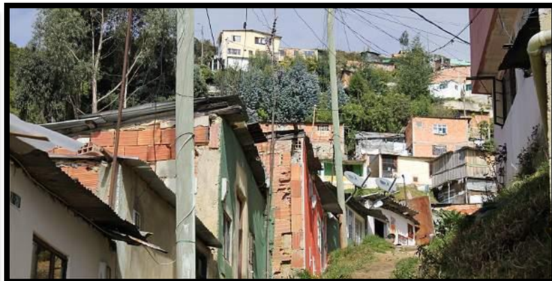
Asentamiento Arauquita II - Usaquén