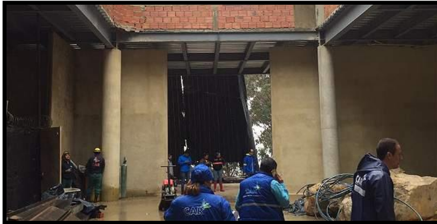
El pauche - Chapinero