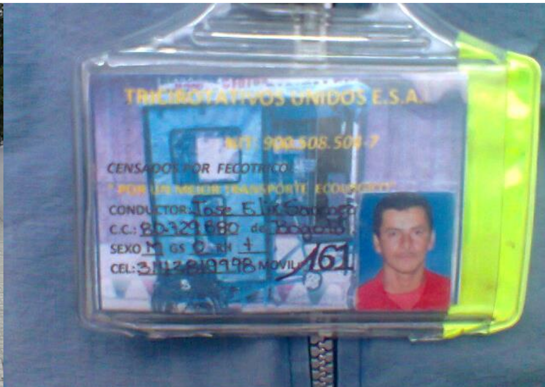
Control a conductores